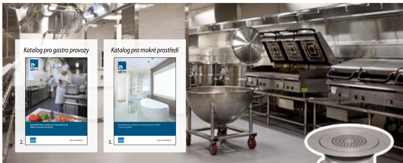
Katalog pro gastro provozy