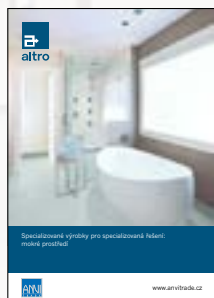
Katalog pro mokré prostředí