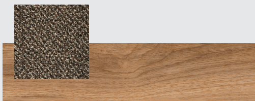
Honey Oak S55W2504 v kombinaci s Artico Clean Delta v dekoru Taupe DE11.

Pro přírodní a jemnější vzhled nabízíme odstín šedozeleň (Taupe). Ten je skvělou volbou pro prostory s prvky z masivního dřeva, kde zvýrazní jejich přirozenou krásu a dodá prostoru útulný a nadčasový nádech.